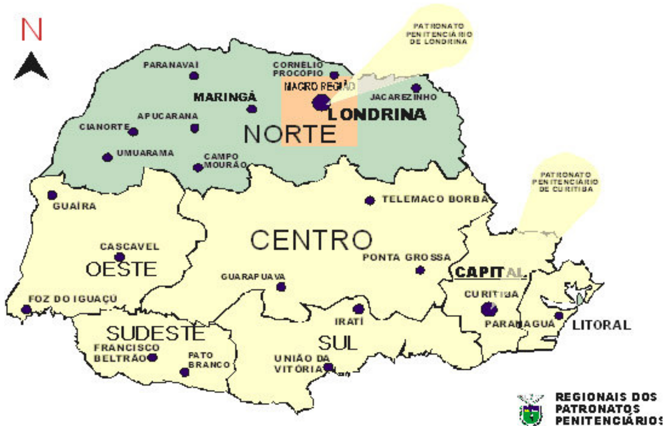
Figura 1 – Mapa de localização dos Patronatos Penitenciários do Paraná

em regime aberto e condenados à prestação de serviços à comunidade. Atualmente, são dois os patronatos penitenciários, localizados em Londrina e Curitiba. O mapa, a seguir, demonstra a localização desses patronatos e suas respectivas áreas de abrangência.